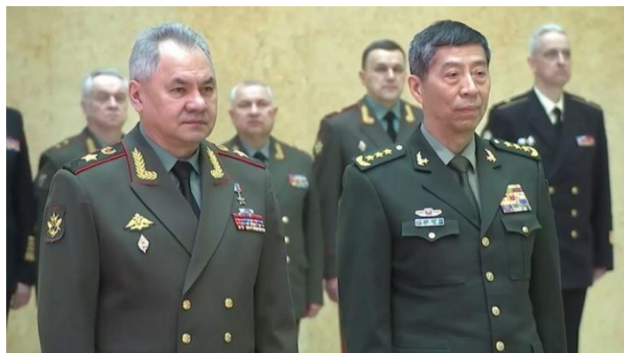
Ministři obrany Ruska a Číny, Sergej Šojgu a Li Šangfu, na summitu v Moskvě

Rusko se tak plně přeorientovalo na Čínu, Indii, Írán a obecně na země BRICS a státy 3. světa. Právě dnes, v úterý, navíc přiletěl do Moskvy nový čínský ministr obrany [2] a stráví v Rusku celé 3 dny. Část jeho pobytu bude přitom neveřejná. Bude se prý jednat o rozvinutí vojenské spolupráce. Mluví se dokonce o vojenském paktu, o prvních obrysech jeho podoby. Nejde tím pádem o zdvořilostní návštěvu, jde o vojenskou spolupráci na nejvyšší úrovni v nějaké věci, v nějaké operaci. V této situaci se už "čínský mír" v Evropě jeví úplně jinak. Ať už se dohodne o osudu Ukrajiny cokoliv, Moskva a Peking už rozvíjí jinou úroveň spolupráce, která nemá žádné historické obdoby. A důvod je prostý.