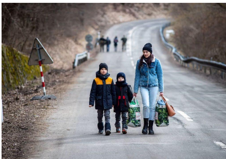
Ukrajinci prchali před válkou podle svého etnického původu. Ukrajinci s ruskou národností do Ruska, Ukrajinci ze západu Ukrajiny do EU

A že na Ukrajinu se nevrací ani ne tak proto, že by je Putin násilím držel v Rusku, ale kvůli tomu, že mají strach se vrátit na Ukrajinu, kde se na Ukrajince uprchlé do Ruska hledí jako na kolaboranty. Podle analytika CNN má sice Kyjev právo být našťvaný na všechny, kteří vyjadřují sympatie k Rusku, ale neměli by prý do toho být zahrnováni uprchlíci, kteří prostě po vypuknutí války neměli na výběr a museli opustit své domovy.